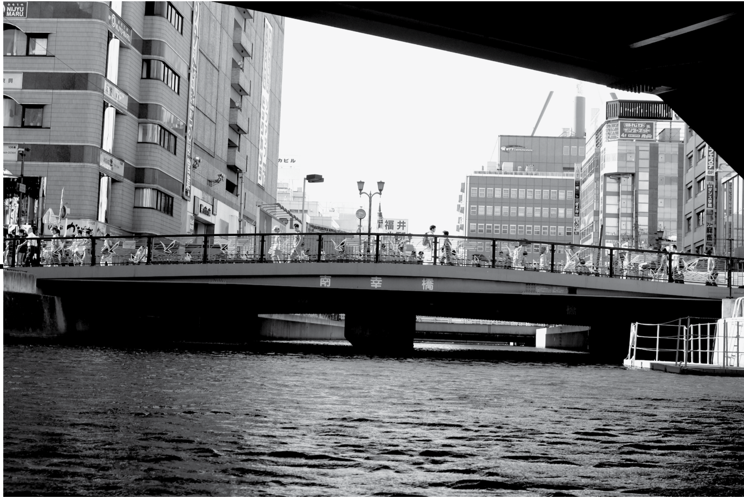
カヤックに乗り、川から横浜の街を望む。 写真左 幸川 新幸橋 写真右上 梶子川 万葉橋下 写真右下 大瀬川 新幸橋

BY MERELY SHIFTING OUR FOCUS, THE CITY, WHICH WE USUALLY SEE AS A SOLID "REALITY" LIKE THE HARD, CONCRETE GROUND, UNDERGOES A GREAT TRANSFORMATION.